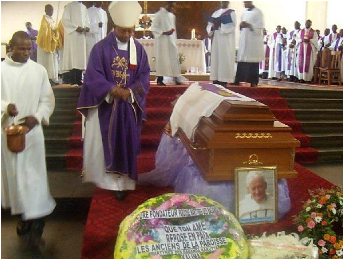
Une grande foule participa aux impressionnantes funérailles du P. Baudouin présidées par l'Archevêque de Lubumbashi