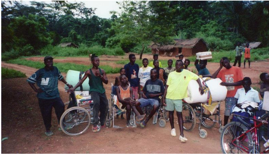
Transport de colis depuis La Hulpe jusqu'à Mingana. Dernière étape : de Kipaka à Mingana, 60 km, à pied...