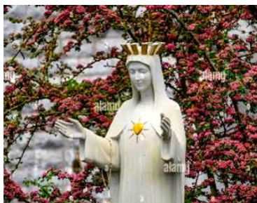
La Vierge de Beauraing.

Le mois d'octobre est souvent appelé le mois du rosaire.